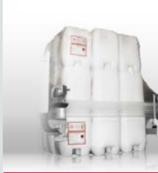
Boş bidon ve kutular